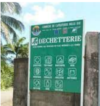
Déchets acceptés à la déchetterie