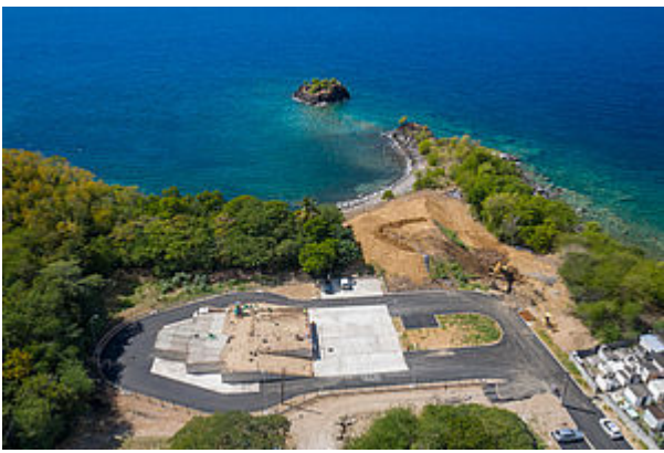
La Déchetterie de Bouillante

Pour la sécurité de tous, il est important que les consignes de sécurité soient respectées et que le civisme soit de rigueur envers autrui.