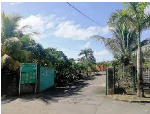
La déchetterie de Capesterre-Belle-Eau