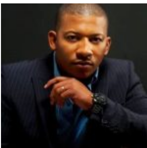
Jean-Philippe COURTOIS, Maire de Capesterre Belle-eau