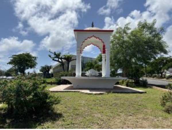
Statue Capesterre Belle eau