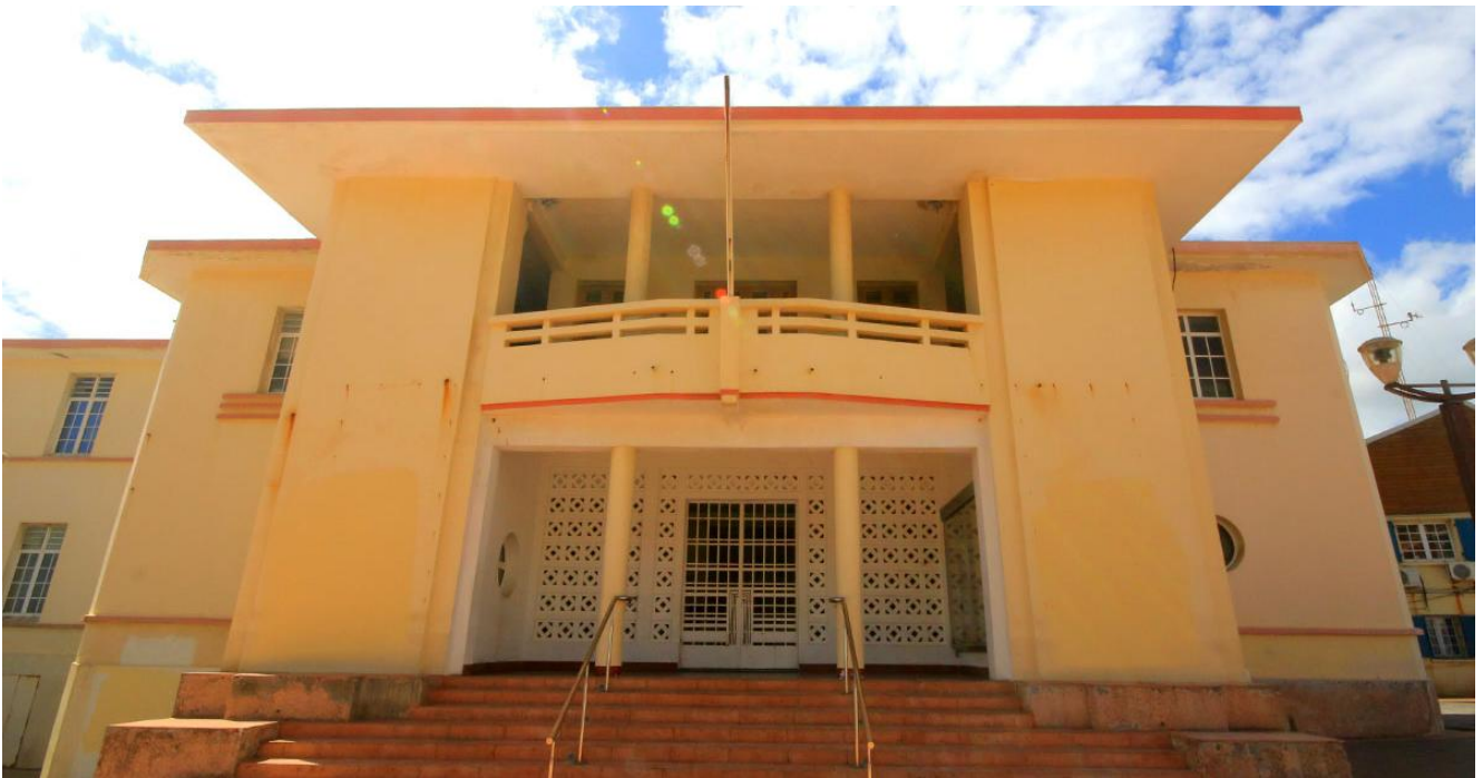
Hôtel de Ville de Capesterre Belle Eau