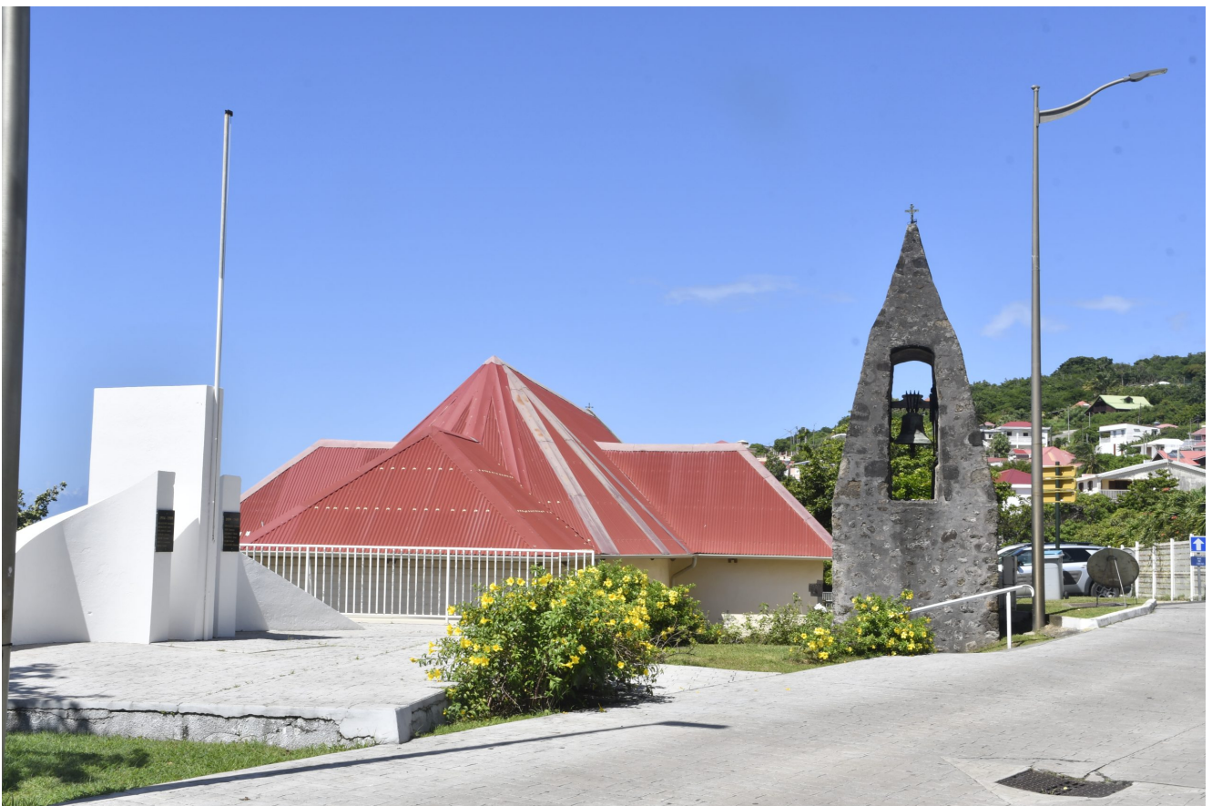
Clocher de l'église de Vieux-Fort