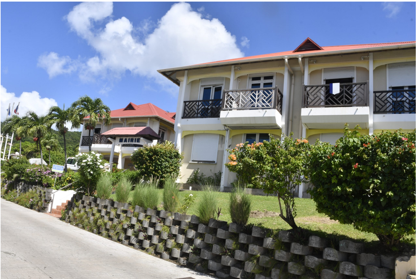
Hotel de ville de Vieux-Fort