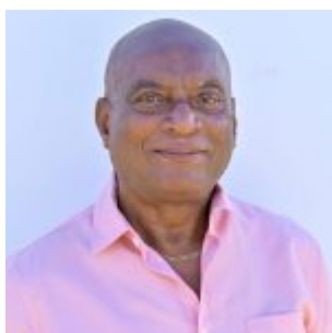
Héric ANDRE, Maire de Vieux-Fort