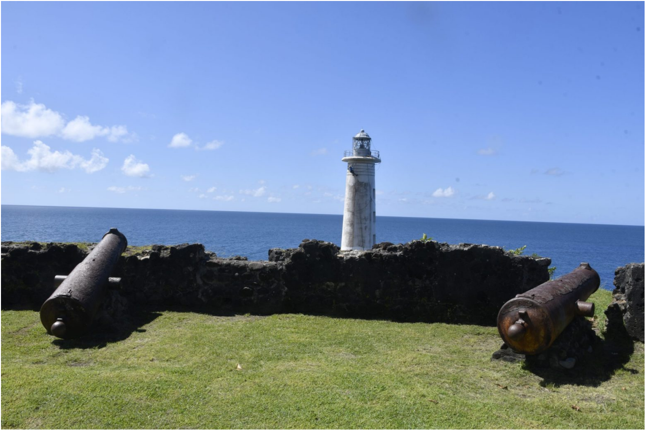
Phare de Vieux-Fort