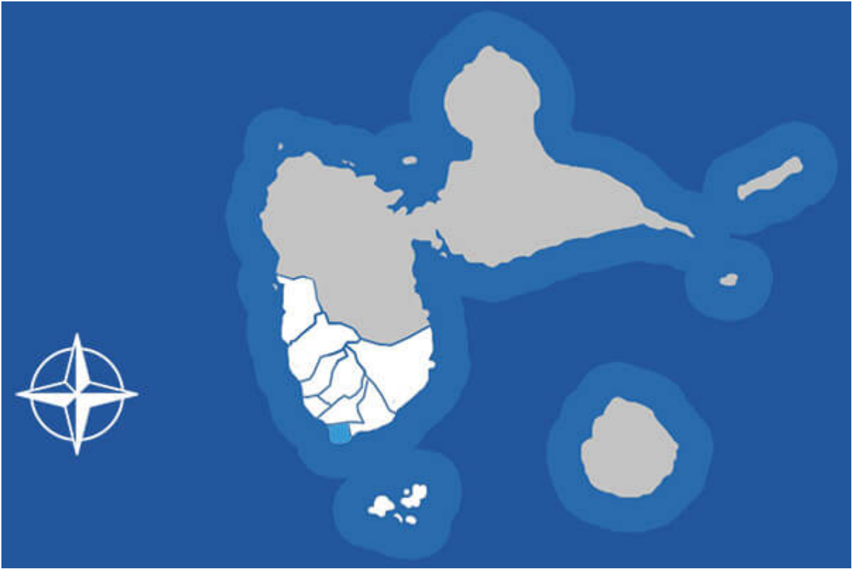
Situation de Vieux-Fort